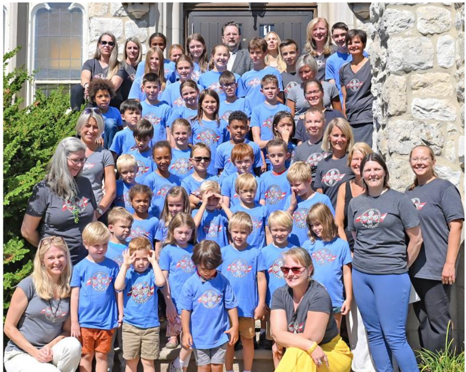
Nudžersijas skola pirmā skolas dienā 2022. gada 10. septembrī

Paldies pienākas ikvienam, kas pielika roku, lai šī