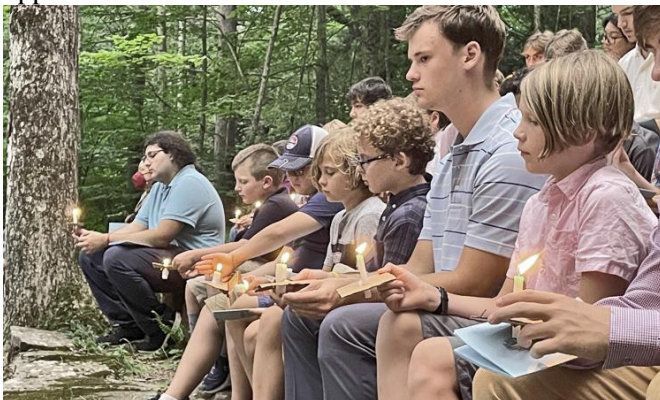
The opening Svecīšu dievkalpojums

The weather cooperated with nearly magical consistency, giving us beautiful days to enjoy activities such as meža mājas, tautus bumba, peldēšana, yoga pie Karogu laukum, a BBQ lunch, star-gazing, and ugunskurs. A highlight of our outdoor recreation was the hike to Spruce Top mountain, the backdrop to so many of our activities, gatherings, and of course photo opportunities.