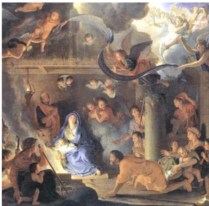
Gani Jēzus bērniņa raudzībās - Charles Le Brun

Bet Dievs nav savus bērnus aizmirsis un pametis.