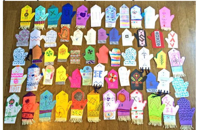
Skolēnu zīmētie cimdu apsveikumi

Šī gada cimdu akcijas ietvaros bērni, savu skolotāju vadībā, gatavoja apsveikumus Latvijas vientuļajiem pensionāriem – konkrēti, Kurzemes novada pansionāta “Gudenieki” 50 iemītniekiem. Strādājot pie šiem apsveikumiem, mūsu bērni ne tikai sagādāja prieku vientuļiem cilvēkiem Latvijā, bet arī iemācījās vairāk par latviešu rakstiem un tautiskajiem cimdiem, ko no paaudzes paaudzē ir adījuši un dāvinājuši mūsu senči.