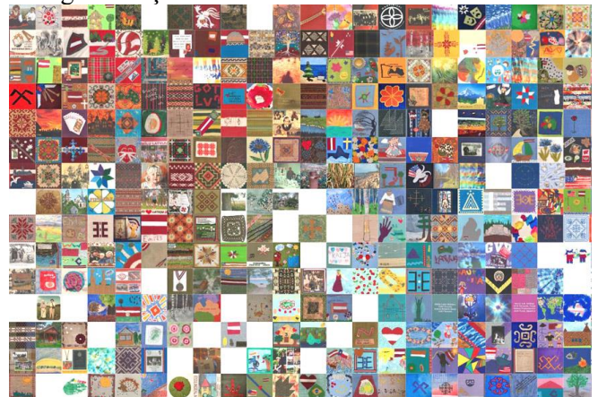
Stāstu segas kvadrāti

piederību Latvijai, ieguldot kopīgā rokdarbā gan savas domas par Latviju, gan arī darbu. Projekts devis iespēju latviešiem ārzemēs visās paaudzēs aktīvi līdzdarboties Latvijas simtgadē neatkarīgi no viņu dzīves vietas, vecuma un valodas spējām. STĀSTU SEGA ir unikāla dāvana Latvijai, kura liecinās nākotnes paaudzēm, ka Latvijas simtgades laikā dzīvojušajiem latviešiem pasaulē viņu Tēvzeme ir svarīga un mīļa!