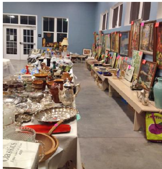
Pag juū gada tirdzi ū nometn .

Pal dz bas fonda komitejas priekūsniece.