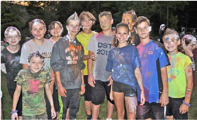
Messy campers after an awesome game of Rainbow Tag.