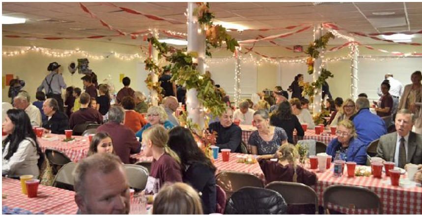
Oktoberfest malt te Jonkeru bazn cas pagrab

Ar to v l nebija gana - 24. oktobr visi akli ros j mies tradicion laj uten , t d j di nopelnot v l apm ram 1000 dol ru jaunajai vannas istabai!