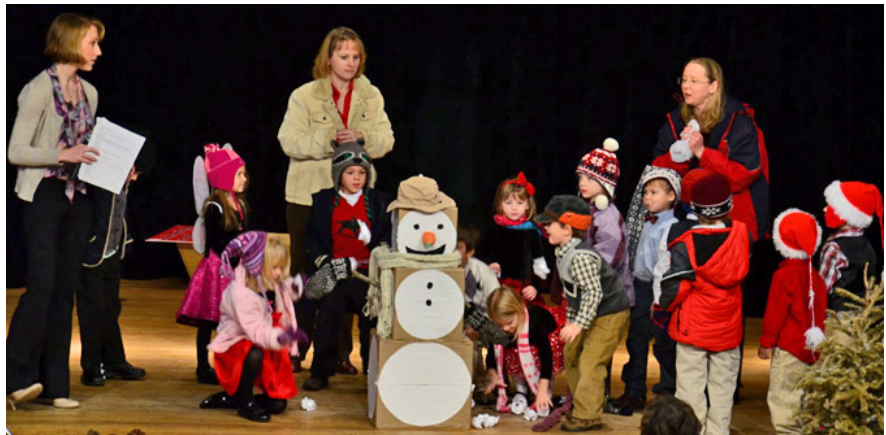
Bērnu dārzs un pirmskola priecājas par pirmo sniegu

Pēc kopīgi nodziedāta „Jūs, bērniņi, nāciet,” māc. Saivars svētbrīdī apcerēja domu, ka Ziemsvētku dāvanu meklēšana un