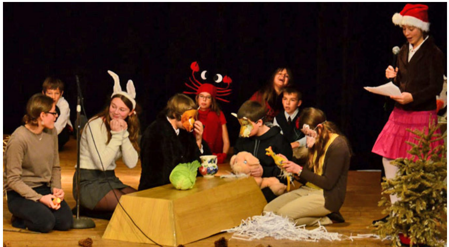
8. klases dzīvnieki mēlojas pie abras