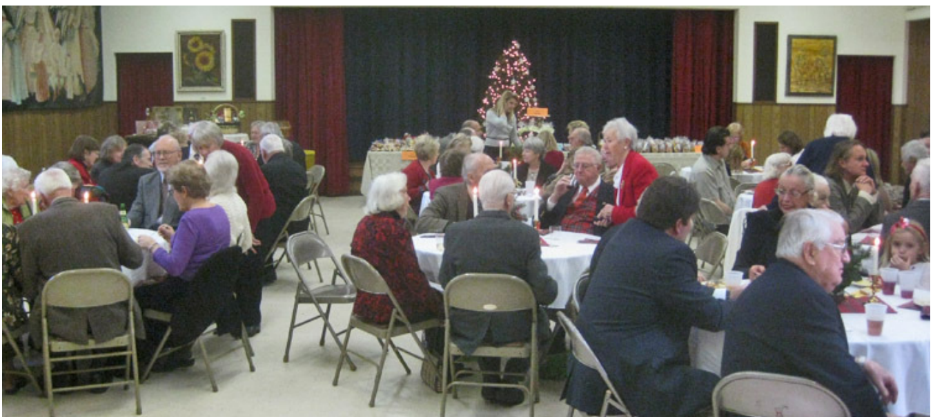
Ziemssvētku tirdziņa saime Salas baznīcas sabiedriskās telpās