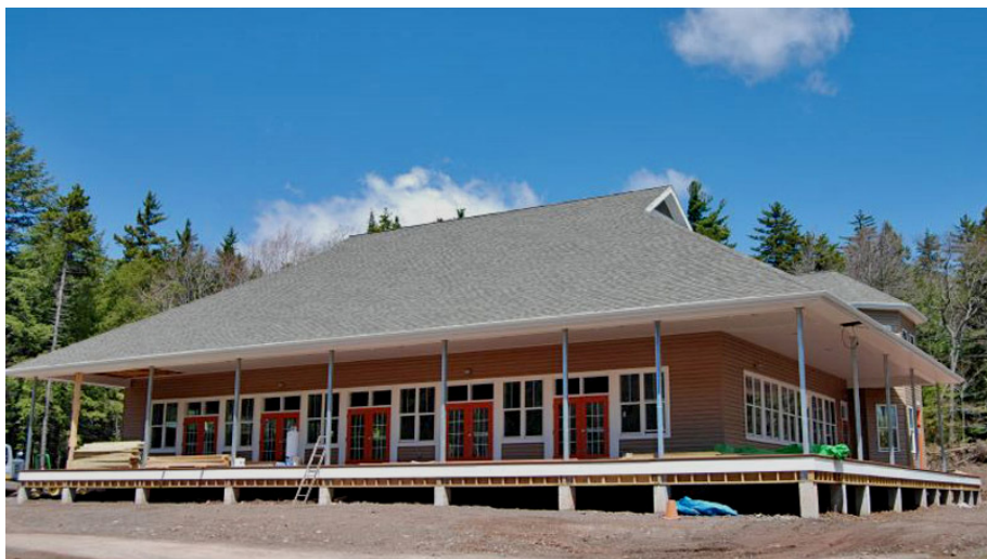
Jaunā ēdamzāle 26. aprīlī