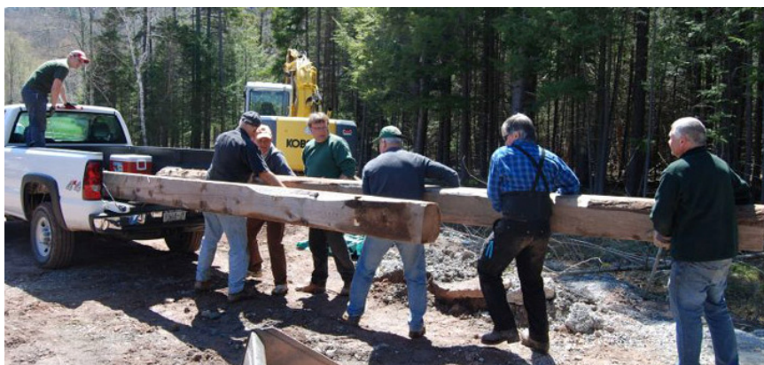
Vecās ēdamzāles sijas turpinās kalpot kā sēdvietas ugunsкура vietā