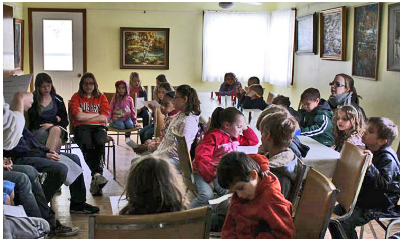
Skola mācās Atpūtas namā