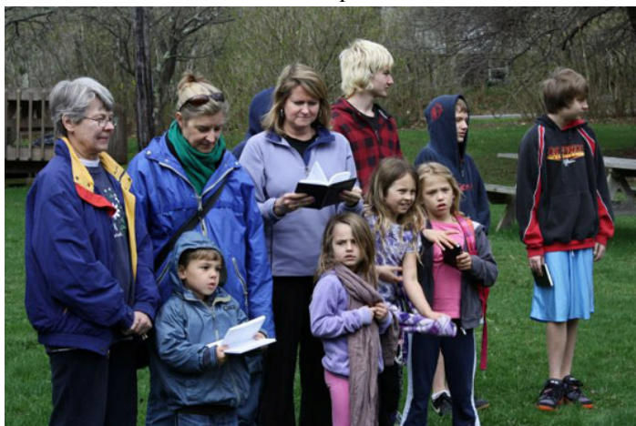
Rīta lūgšana pie dīķa