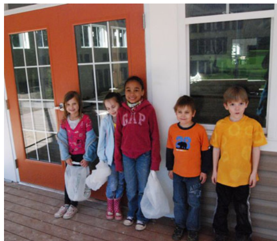
Bērni gaida spert pirmos soļus ēdamzālē