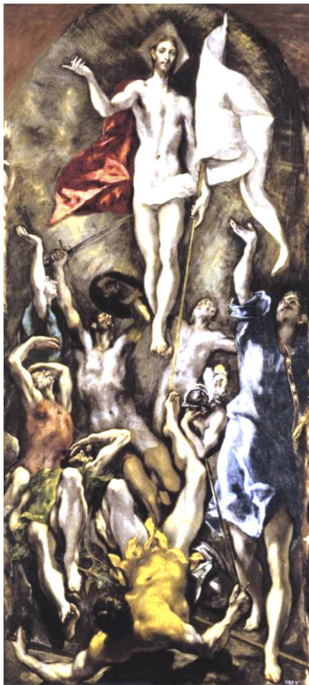
Augšāmcelšanās – El Greko, 17. g.s.

Uz dziesmu lapiņas redzam, kā grieķu izcelsmes Spānijā gleznojošais lielmeistars El Greko iedomājās Kristus augšāmcelšanās pārtapšanas notikumu. El Greko attēlo mirklī, ko Bībele neapraksta. Mēs it kā redzam pirmo brīdi, kad miesīgā ķermeņa mirušais Jēzus ir pārtapis par garīgā ķermeņa mūžīgi dzīvo Kristu. Sargi, kas bija pie Jēzus kapa vaktējuši, ir satraukumā un chaosā. Daži ir novēlušies garšļaukus, citi pacēlušī rokas – varbūt bailēs, varbūt pat godbijībā. Nakts vēl ir tumša, bet Kristus pats ir pārtapis par gaismu. Viņš paceļas pāri karavīru tumšām formām – it kā zemes pievilksanas spēks viņu vairs nesaista. Kristus starojošais ķermenis ir gandrīz kails. Viņa labā roka ir pacelta ar delnu uz augšu, no kurienes viņš saņem svētību. Viņa