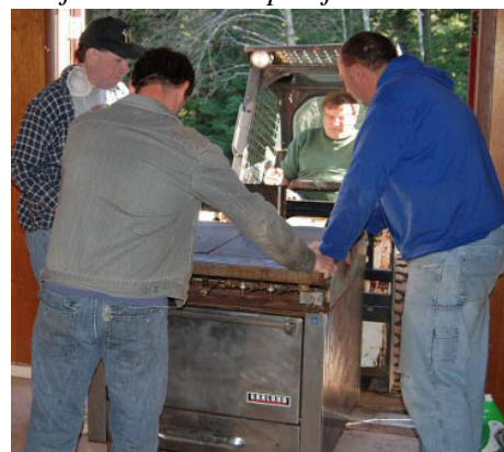
Būvdarbus nobeigs maija mēnesī